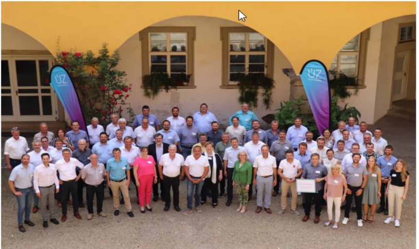
Die Teilnehmer und Teilnehmerinnen der Gründungsveranstaltung sowie des Netzwerktreffens im Innenhof des Schlosses Zeilitzheim.